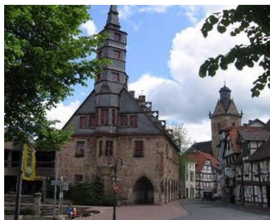
De KBO Zeeland reis ging o.a. naar het stadje Korbach.